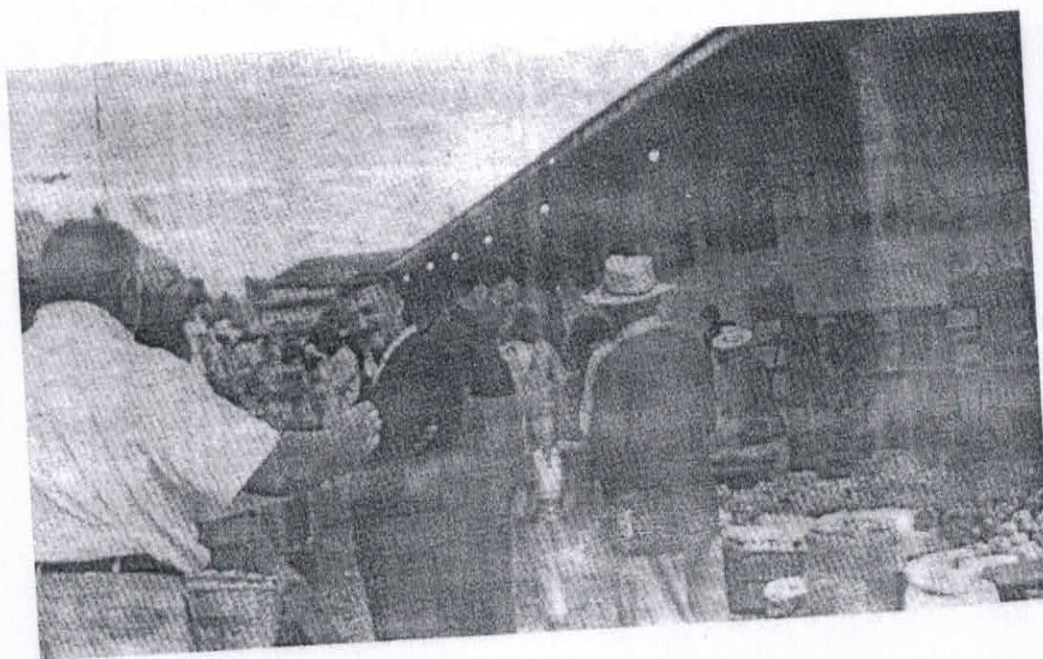
Década de 1970 – exterior do Mercado Municipal