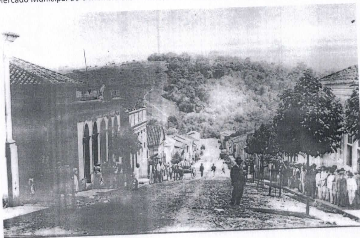
1908- Mercado Municipal de Ouro Fino