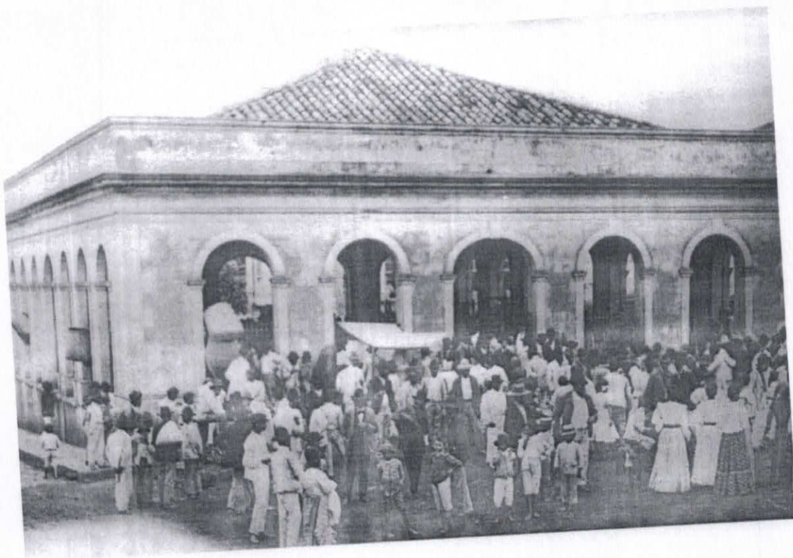
Aproximadamente 1925- Manhã de domingo – Mercado Municipal