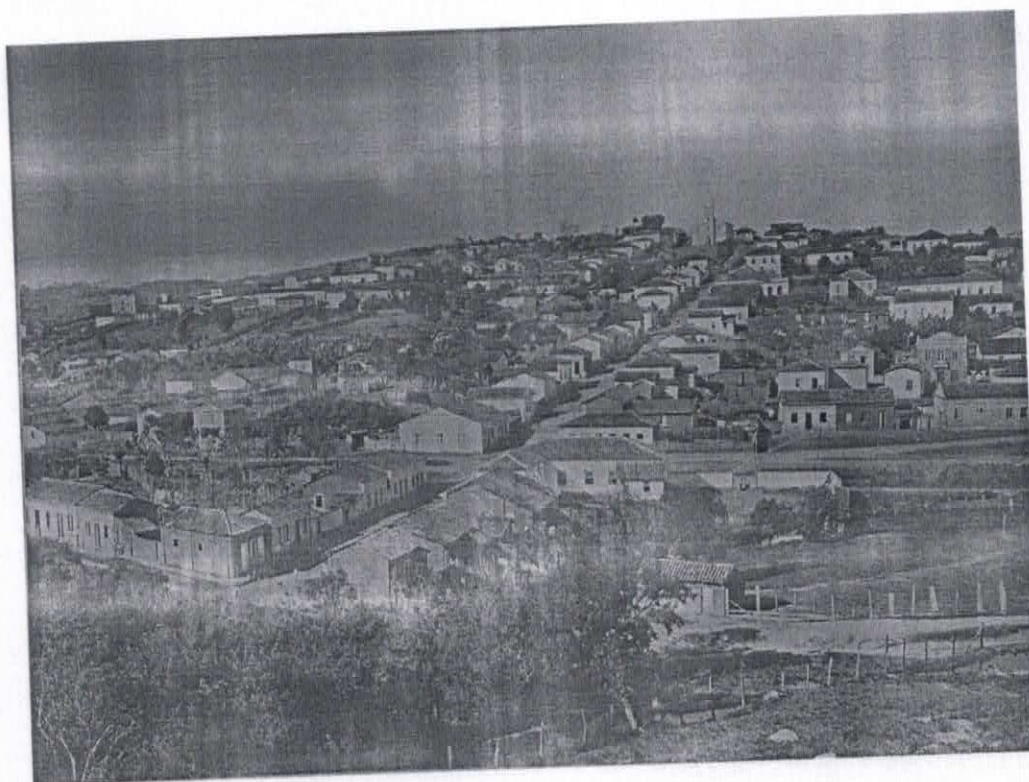
Mercado Municipal de Ouro Fino até 1914, quando foi ampliado no mesmo local